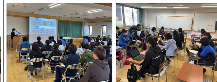
* 小中の教職員が協働して、系統的に9年間の学びの環境を支えます。

5月9日（木）大田原中学校区多目的室にて大田原中学校区小中一貫教育校区会議（全体会）を行いました。