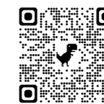
【睡眠とデジタル機器】