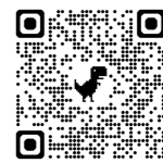
【生活習慣を見直そう】