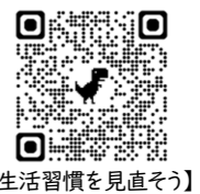
【生活習慣を見直そう】