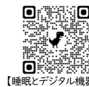
【睡眠とデジタル機器】